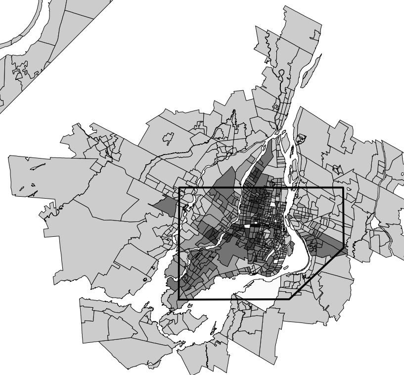
RMR DE MONTRÉAL Proportion d'allophones*, 2001, selon les secteurs de recensement